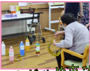
おじゃめボクレー