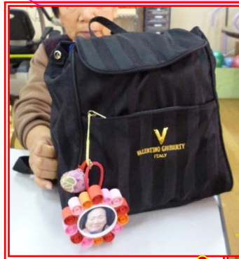
フォトフレームのプレゼント