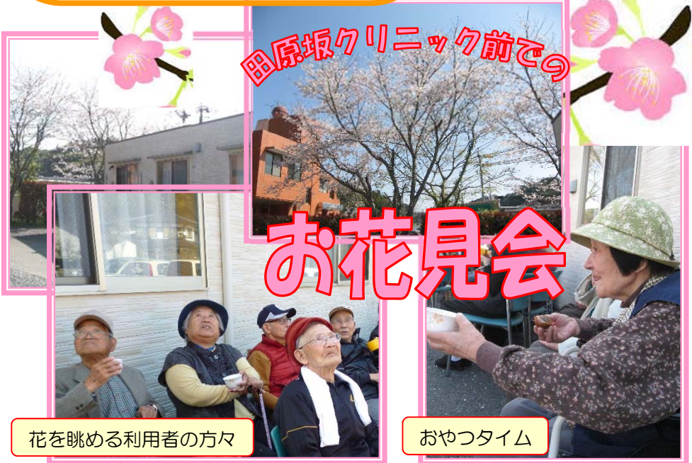
田原坂クリニック前での