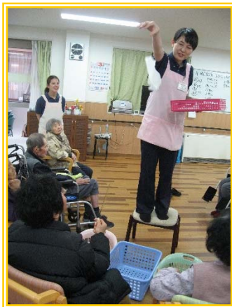
外で楽しくレクリエーション