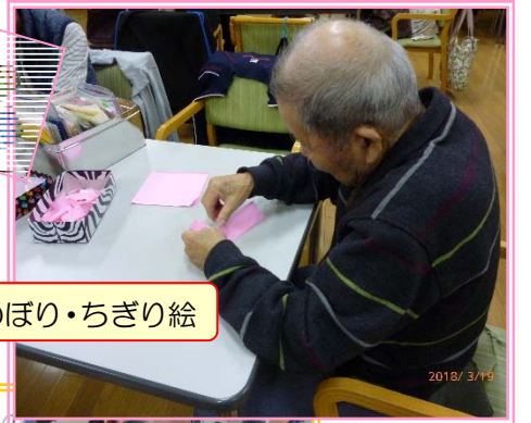
こいのぼり・ちぎり絵

2月より利用者の皆様と職員とで制作していたフォトフレームが完成し、先日皆様へプレゼントしました。早速バッグに付けられた方もおられ、喜んでいただけた様子でした。3月より鯉のぼりのちぎり絵を始めました。大きな作品になる予定です。皆様と協力・分担して作っていききたいと思っております。